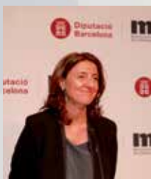
Mercè Conesa i Pagès, Presidenta de la Diputación de Barcelona