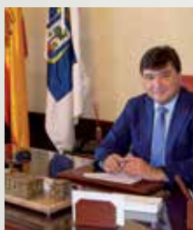
Gabriel Cruz Santana, Alcalde de Huelva