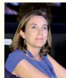
Concepción Gamarra Ruiz-Clavijo, Alcaldesa de Logroño (La Rioja)