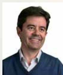
Luis Felipe Serrate, Alcalde de Huesca