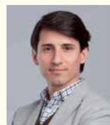
Jesús Mº Zaballos de Llanos, Alcalde de Lasarte-Oria (Guipúzcoa)