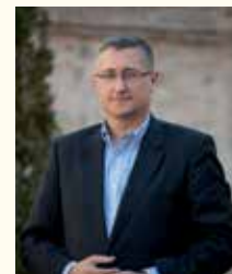
Manuel Blasco Marques, Alcalde de Teruel