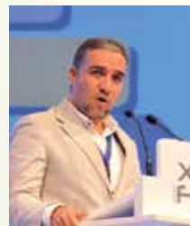
Elías Bendodo Benasayag, Presidente de la Diputación de Málaga