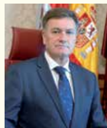
Francisco Vázquez Requero, Presidente de la Diputación de Segovia