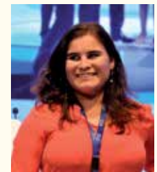
Concepción Brito Núñez, Alcaldesa de Candelaria (Sta. Cruz de Tenerife)